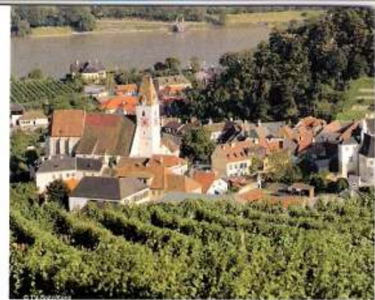
Spitz in der Wachau