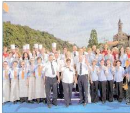
Die Crew Ihres nicko tours Schiffes freut sich auf Sie

Aufpreis bei Buchungen ab 1.2.09 50,-€ pro Person